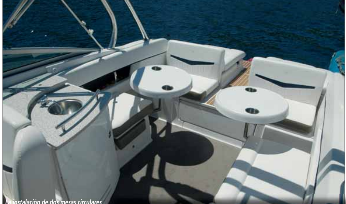
La instalación de dos mesas circulares en la bañera permite convertir el área en una agradable dinette al aire libre.

La consola aparece dividida en dos, ofreciendo una guantera en babor y un cómodo acceso →