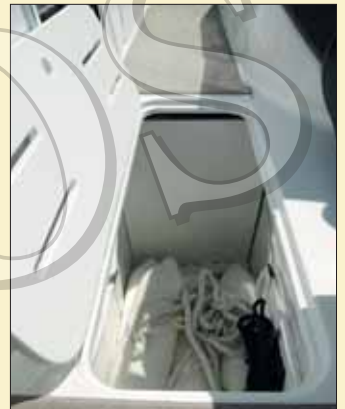
Un cofre situado en el eje de crujía proporciona las dimensiones necesarias para almacenar esquís y tablas de wake.

El modelo, dotado del diseño de carena extendida Stable-Vee™ patentado por la compañía, con cuatro redanes por banda y una proa en forma de V, ofrece agarre, estabilidad y rendimiento.