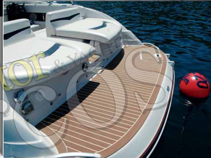
▲ La plataforma de baño de la unidad probada lucía una superficie forrada en teca sintética orientada a optimizar la seguridad y el confort.