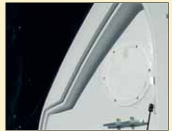
El equipamiento de serie del modelo incluye un cofre de anclas dotado de molinete eléctrico, ancla y cadena.