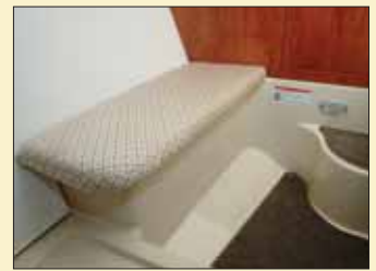
Un pequeño asiento individual junto a la entrada aportará un extra de confort al alojamiento proporcionado por el camarote.