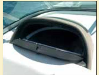
La sección de babor de la consola incorpora una guantera perfecta para guardar pequeños accesorios que deban permanecer a mano.