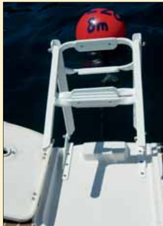
Instalada a estribor de la plataforma de baño encontramos una escalera de baño plegable que destaca por su longitud y por sus amplios escalones.