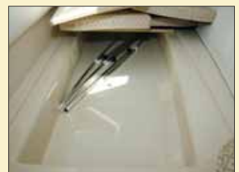
La cama esconde un amplio cofre de estiba al que se accede tras extraer el colchón y los paneles de madera que ejercen de base.