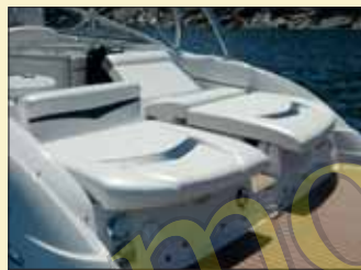
Los dos sofás de popa pueden convertirse en solárium con respaldos regulables y liberan un pasillo central que conduce a la bañera.