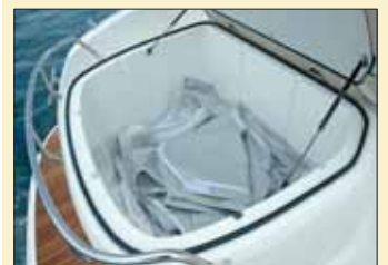
Por popa y bajo la colchoneta, obtendremos un excelente espacio de estiba.