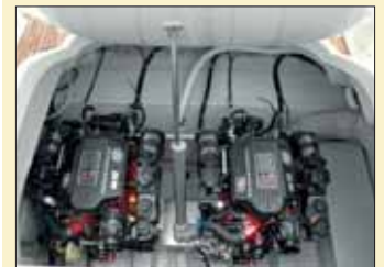
Al levantar toda la tapa que cubre el solárium de popa, accederemos a la instalación de los dos motores Volvo 4.3 de 225 CV cada uno.