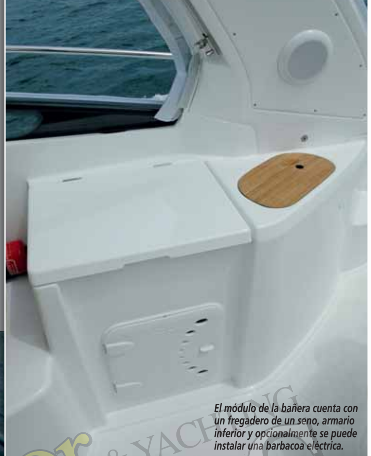
El módulo de la bañera cuenta con un fregadero de un seno, armario inferior y opcionalmente se puede instalar una barbacoa eléctrica.

de estiba. La dinette de la bañera queda constituida por un asiento en U, cuyo respaldo puede abatirse hacia adelante, consiguiendo así unos centímetros adicionales para el solárium comentado. Este mismo asiento transversal alberga en su interior un nuevo espacio de estiba y donde se han instalado los dos desconectores de baterías. Sobre esta zona está el arco de radar, que principalmente se utiliza para instalar la capota camper que, aun siendo un elemento opcional, consideramos ideal para el cerramiento de todo el barco. El puesto de gobierno, como hemos indi- ➔