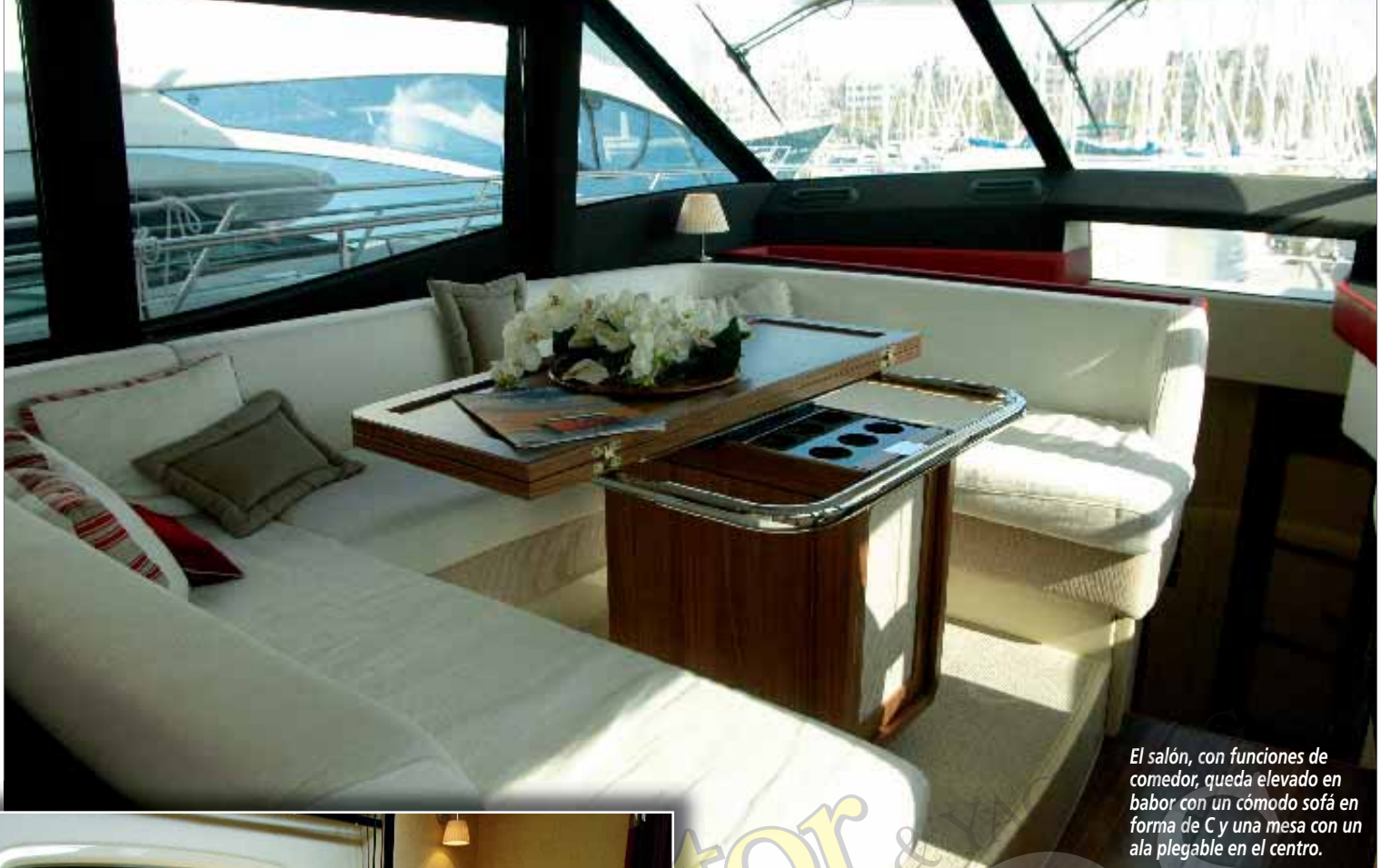
El salón, con funciones de comedor, queda elevado en babor con un cómodo sofá en forma de C y una mesa con un ala plegable en el centro.