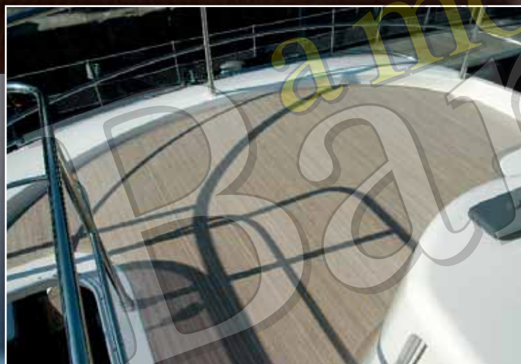
▲ La sección de popa del flybridge se ha reservado, totalmente despejada, a la estiba de la balsa salvavidas.

El resultado de todo ello es un crucero que combina en perfecta armonía un estilo moderno con la tradición marinera, en el que se ha incluido una generosa bañera con un espacio habitable de más de 10 m 2 que se alza por delante de una plataforma de baño hidráulica. En ella, un sofá en forma de C y una mesa ofrecen una capacidad para seis personas, mientras que los dos pasillos laterales unen el espacio con la proa, que se ha amueblado con un agradable salón exterior compuesto por dos confortables asientos en forma de C enfrentados. →