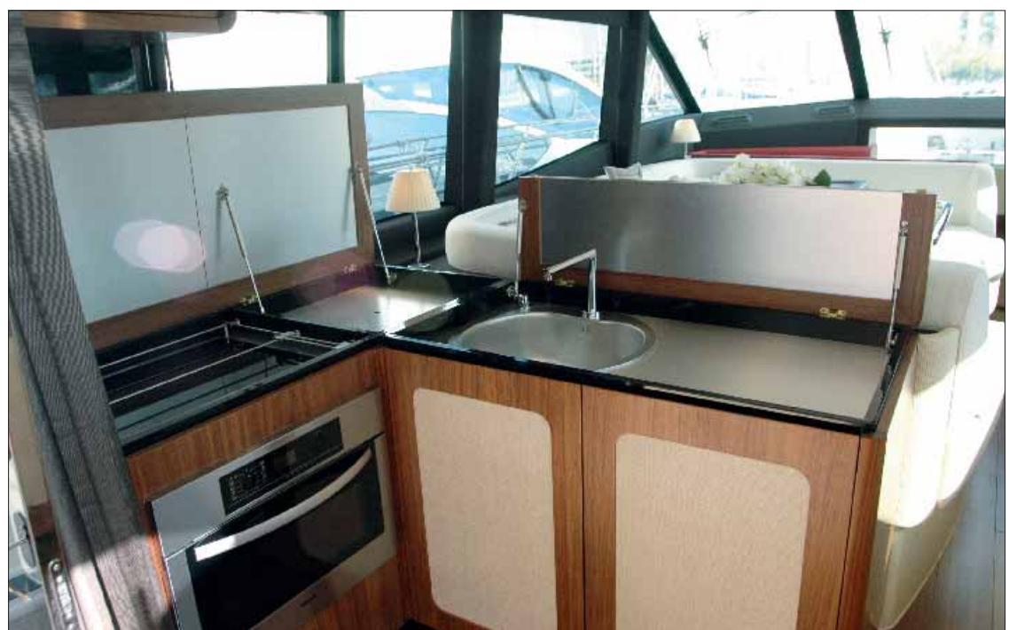
La cocina se ha situado en una zona ▶ intermedia entre la bañera y el salón, y se ha equipado con vitrocerámica, un fregadero de acero inoxidable y una gran capacidad de estiba.

El salón-comedor se eleva ligeramente en babor, proporcionando un cómodo sofá en forma de U y