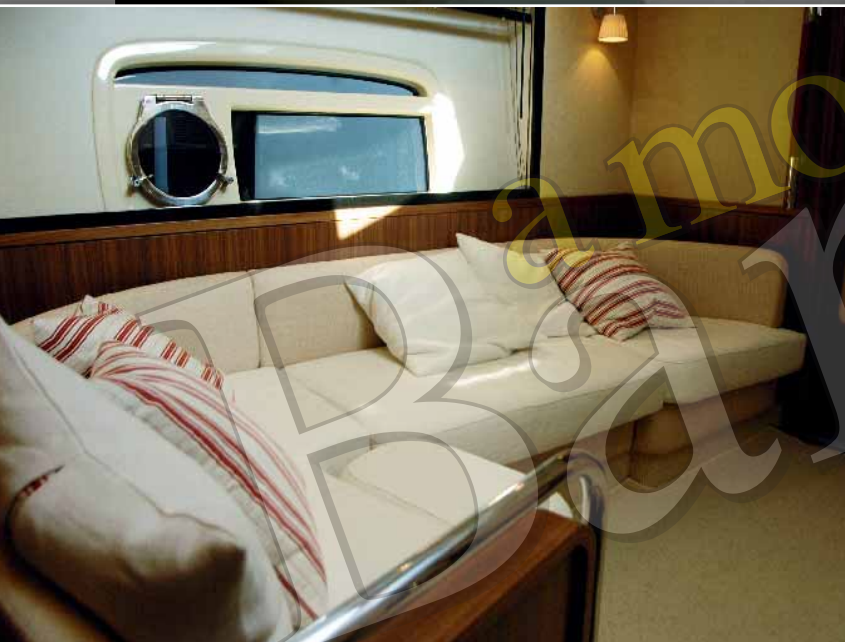
▲ La distribución de la unidad que probamos nos daba la bienvenida a la cubierta inferior con un segundo salón más íntimo, amueblado con un cómodo sofá.